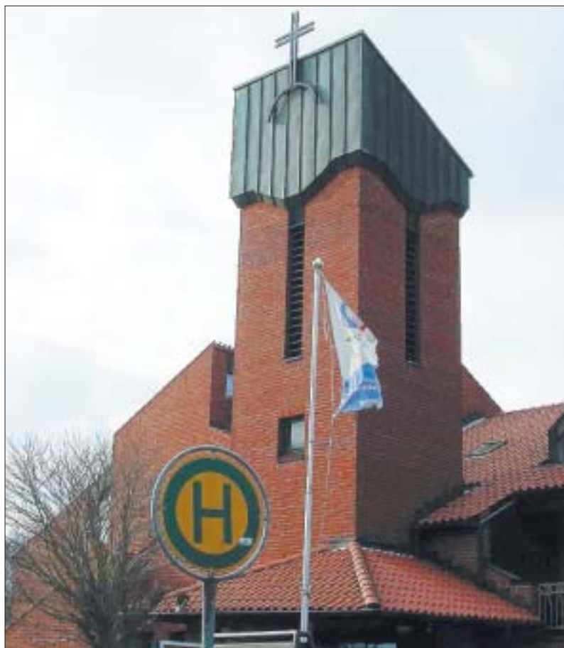
Aussteigen, vor allem aber einsteigen: Die St. Elisabeth-Kirche in Damp, eine Haltestelle nicht nur für Buspassagiere.

Irgendwie erscheint mir dies so typisch für unsere Zeit, für unser kirchliches Tun. Was wir als Kirche tun, ist nicht mehr selbstverständlich, wird nicht mehr als „Not-Wendig“ angesehen. Der Bedarf muss angemeldet werden, es muss Bescheid gesagt werden. So könnten wir ins Jammern