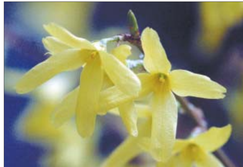
Nun will der Lenz uns grüßen: Im Mai wacht die Natur auf, überall, nicht nur in den Blumengeschäften.

Auch Christen dürfen natürlich in den Mai tanzen. Aber wir sehen das Ende des Winters mit anderen Augen. Christen müssen keine Geister und Götter gnädig stimmen. Unsere Frühlingsstimmung ist nicht die Angst. Wir wissen uns in der Hand des guten Gottes. Gott hat in seiner Schöpfung den Frühling vorgesehen. Er will das Leben erneuern und die Natur zur Blüte und Fruchtbarkeit bringen. Die Menschen können und müssen dabei nicht nachhelfen. Vertrauen und Dank, dankbares Staunen soll uns leiten angesichts